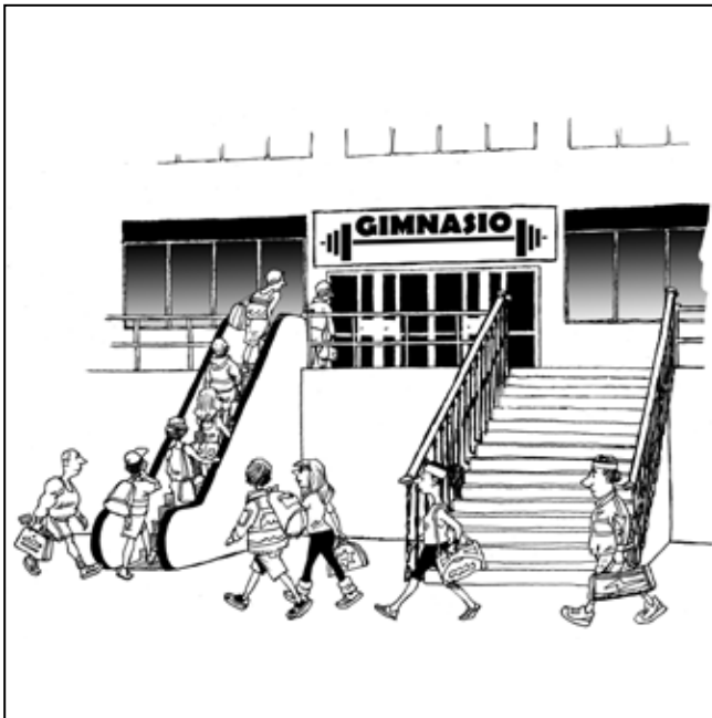
Ventura (Adaptado de un chiste clásico)