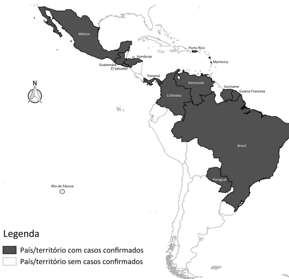
Figura 3 - Países e territórios com casos confirmados de transmissão autóctone do vírus Zika nas Américas, até a semana epidemiológica 52/2015.

Fonte: Organização Pan-Americana da Saúde/Organização Mundial da Saúde. Dados atualizados na semana epidemiológica 52 – 2015/2016 (27 de dezembro de 2015 a 02 de janeiro de 2016).