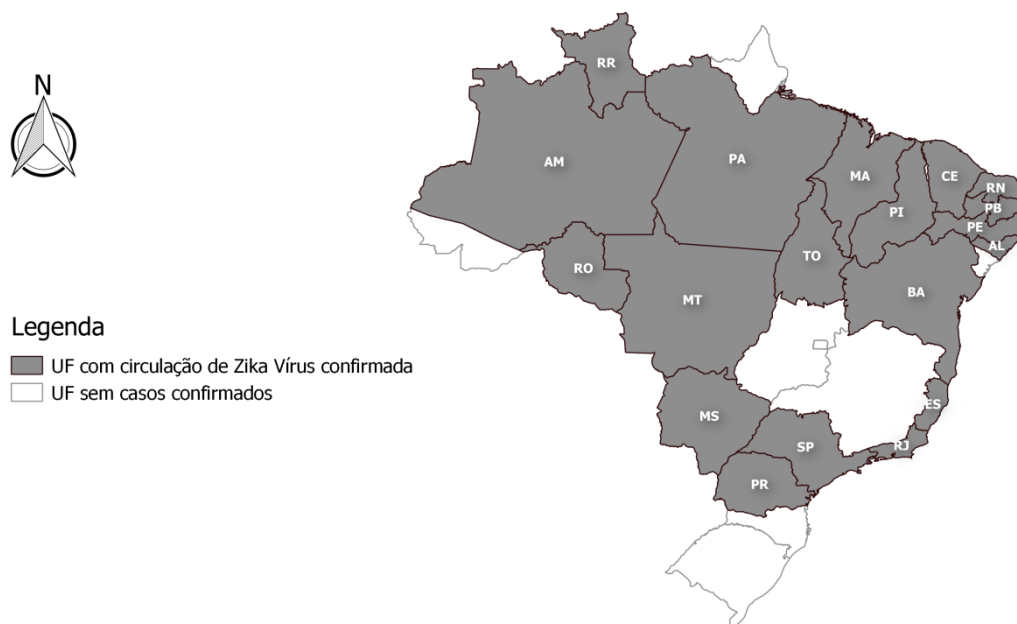
Figura 2 – Unidades da Federação com confirmação laboratorial do vírus Zika. Brasil, 2015/2016.

Fonte: Coordenação-Geral do Programa Nacional de Controle da Dengue (CGPNCD/DEVIT/SVS). Dados atualizados na semana epidemiológica 52/2015 (27 de dezembro de 2015 a 02 de janeiro de 2016).